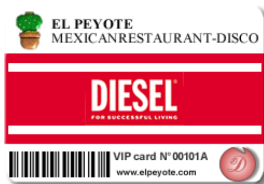
Dcard – versione entry