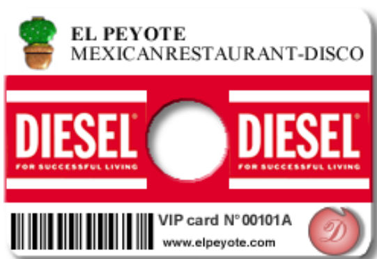
Dcard – versione VIP con traccia multimediale

dgCARD è una tessera con integrato un rivoluzionario sistema informatico che permette di fidelizzare con facilità i clienti garantendo un ritorno pubblicitario attraverso innumerevoli punti di comunicazione.